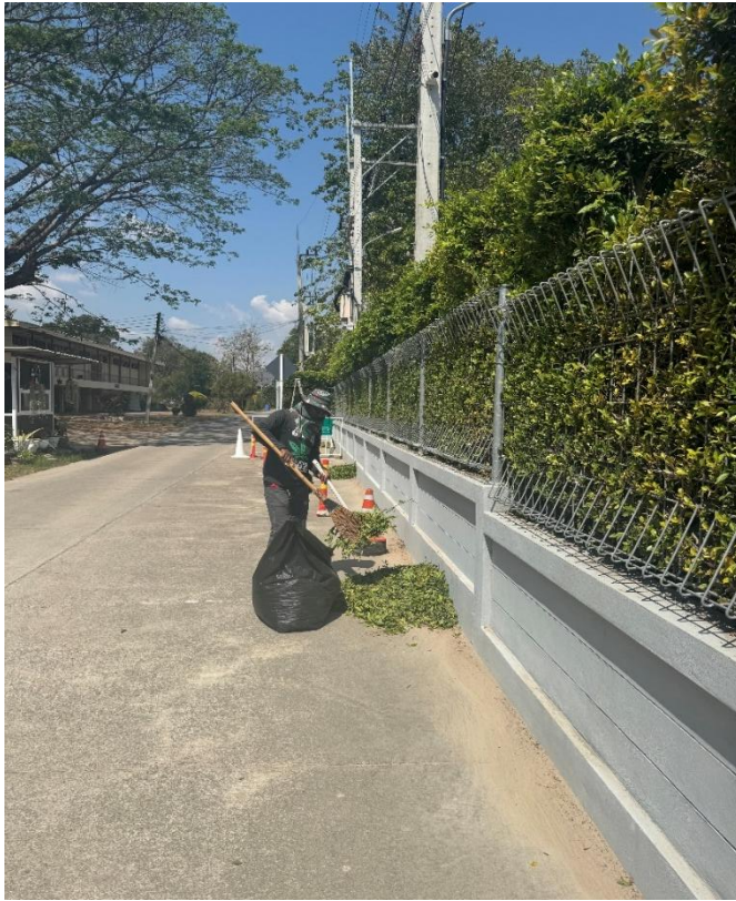
ภาพทำความสะอาดของแม่บ้าน